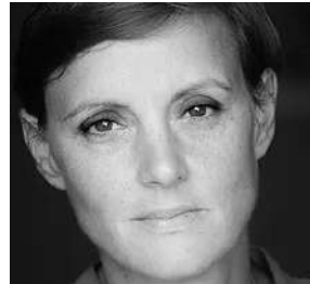
Elise GUILLOU costumes et accessoires

Ses originaux au format géant, véritables œuvres d'art recherchées par les collectionneurs, deviennent pour petits et grands les pages d'albums à contempler des heures, sans se lasser.